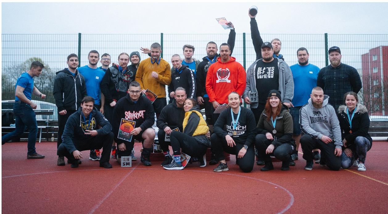
Obrázek 8: Silicon Hill Strongest Man skupinové foto

Soutěž o nejsilnějšího muže a ženu Strahova jako doprovodný program SHOW Strahov. I přes nepřízeň počasí se zúčastnilo 12 mužů a 4 ženy. Soutěž byla otevřena i veřejnosti. Disciplíny byly celkem 4: Super yoke, axle na opakování, kufry a tahání saní.