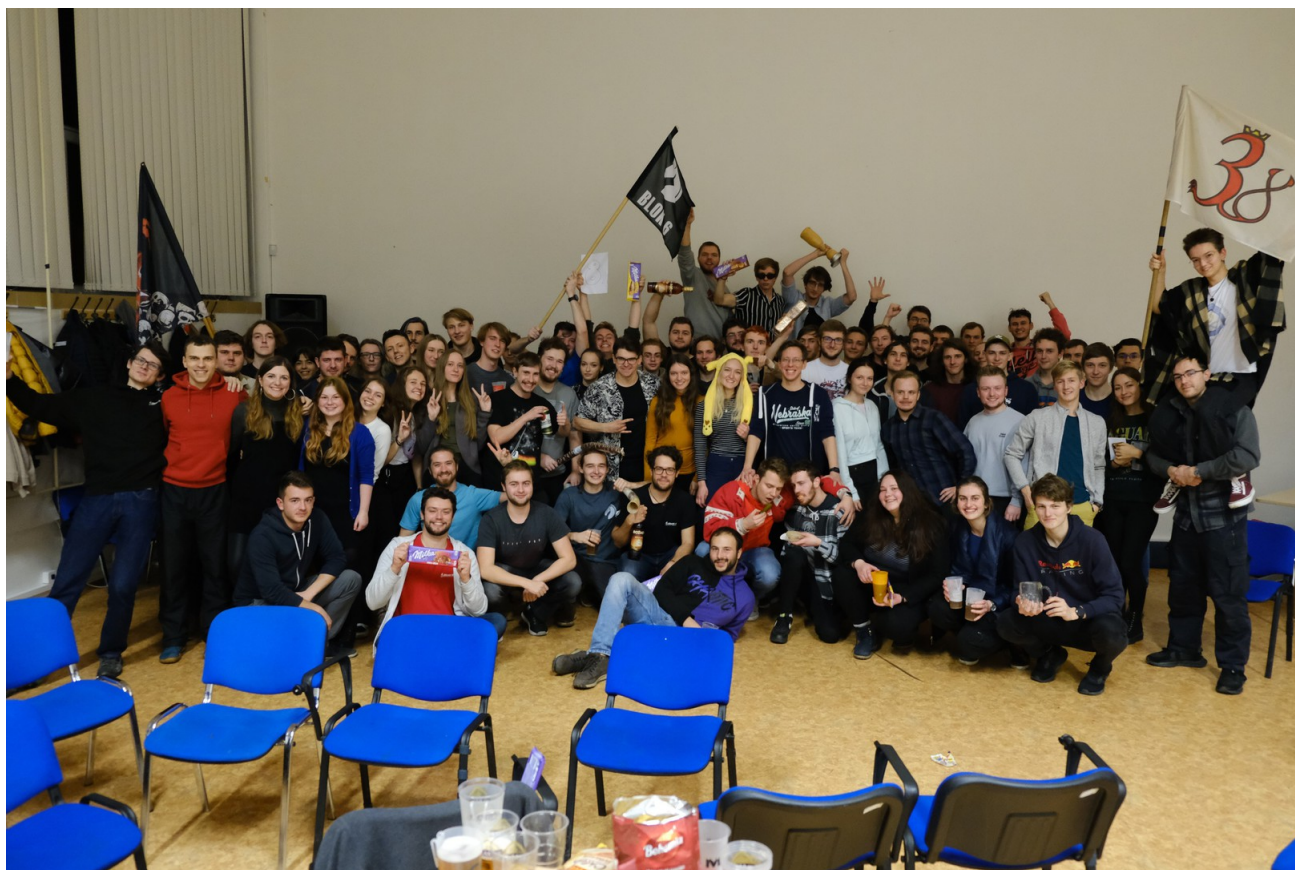
Obrázek 12: Závěrečné zimní Blokové hry