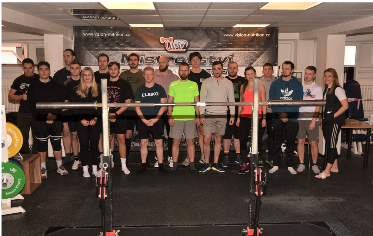
Obrázek 15: Silicon Gym SQUAT & BENCH skupinové foto