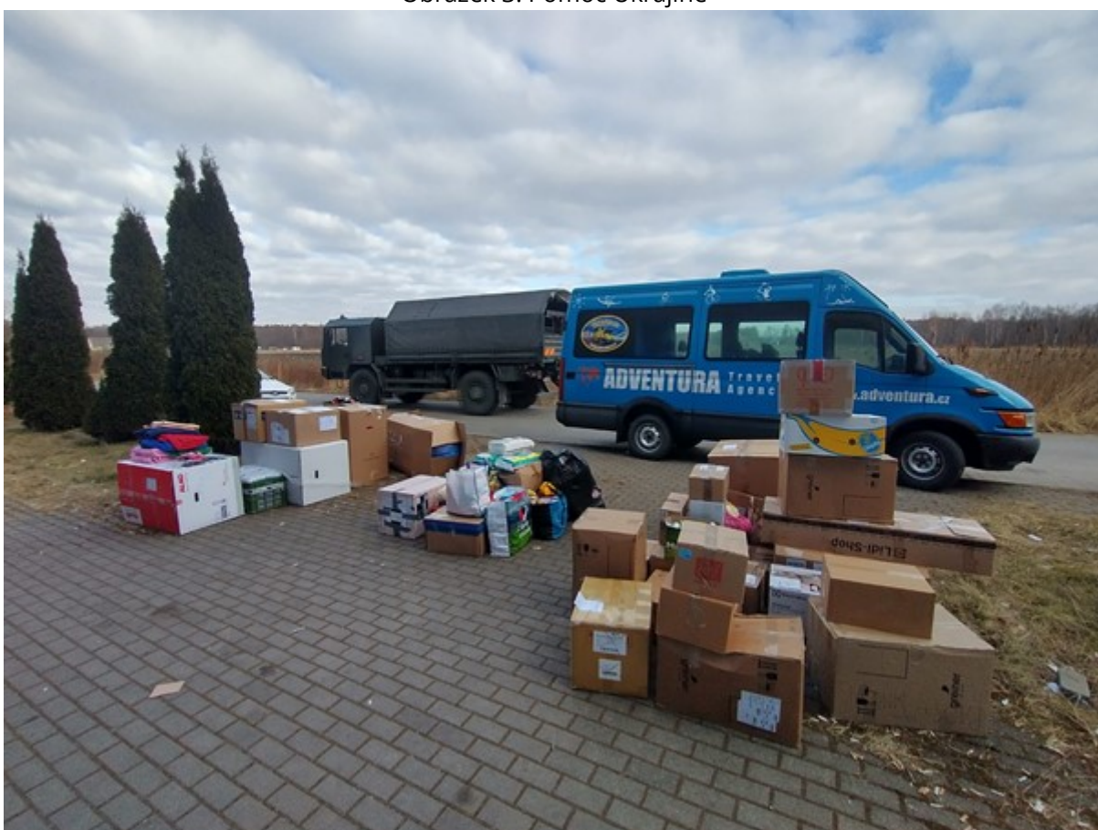
Obrázek 4: Pomoc Ukrajině