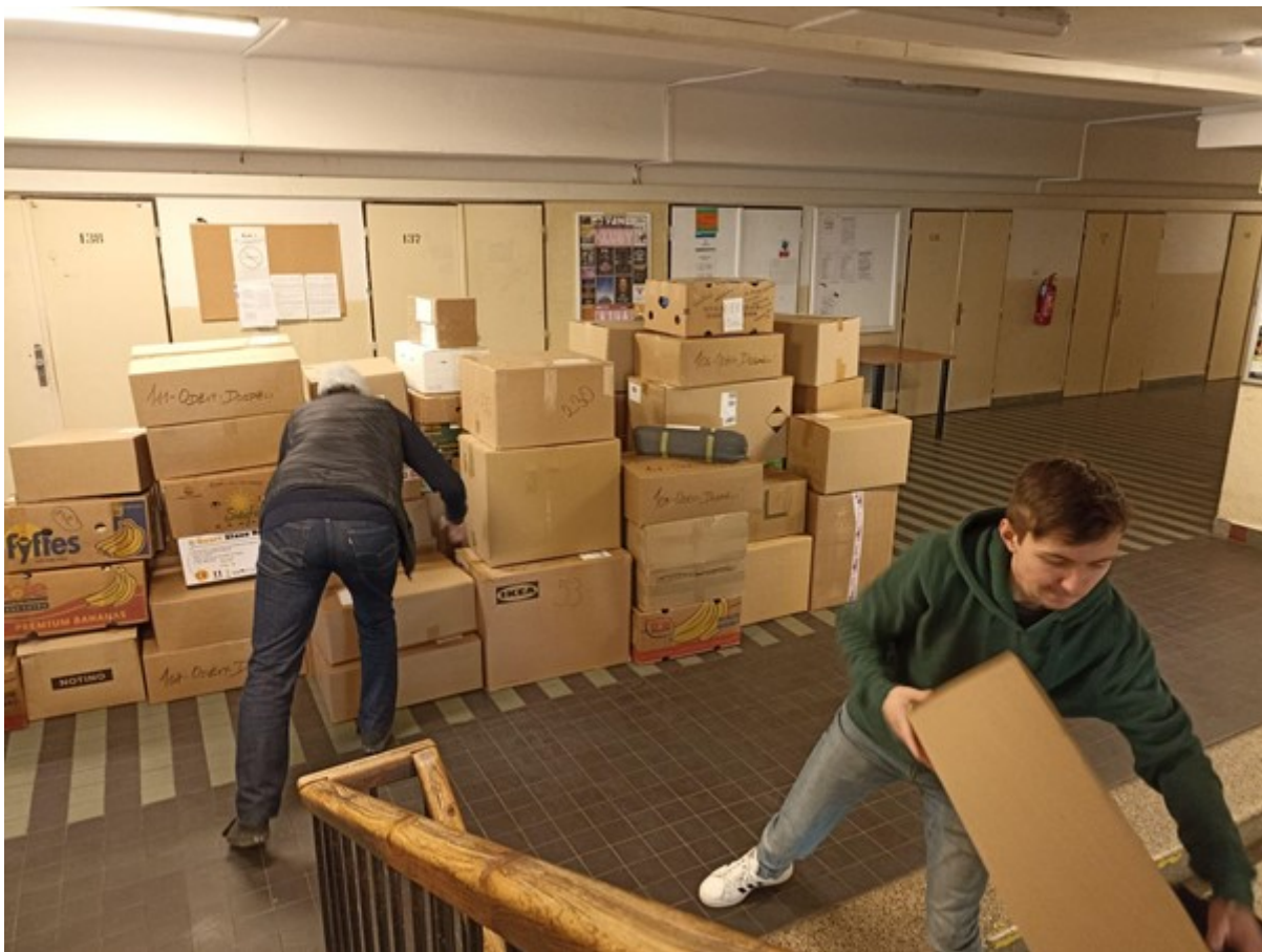
Obrázek 1: Pomoc Ukrajině