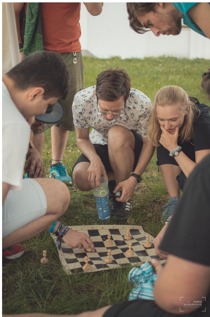
Obrázek 9: Závěrečné letní Blokové hry