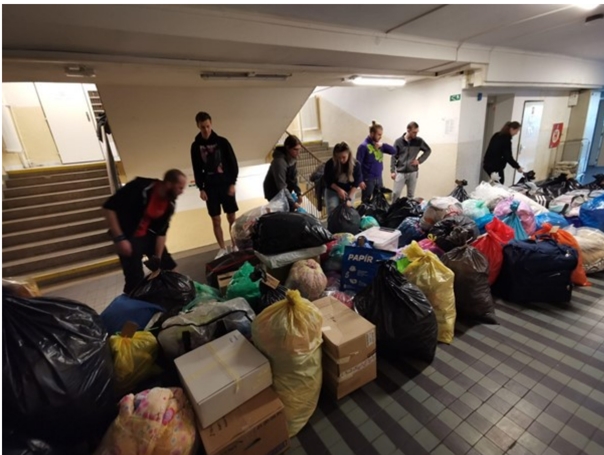
Obrázek 3: Pomoc Ukrajině