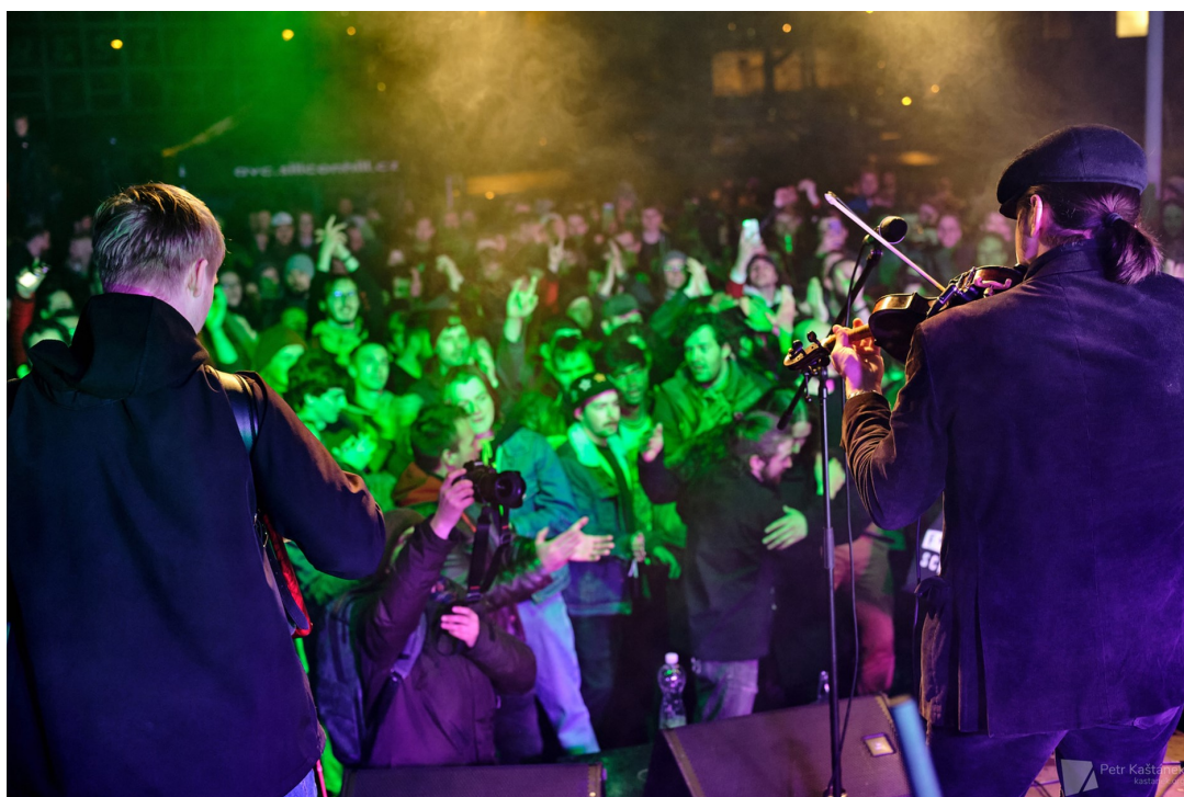
Obrázek 7: Malá stage SHOW