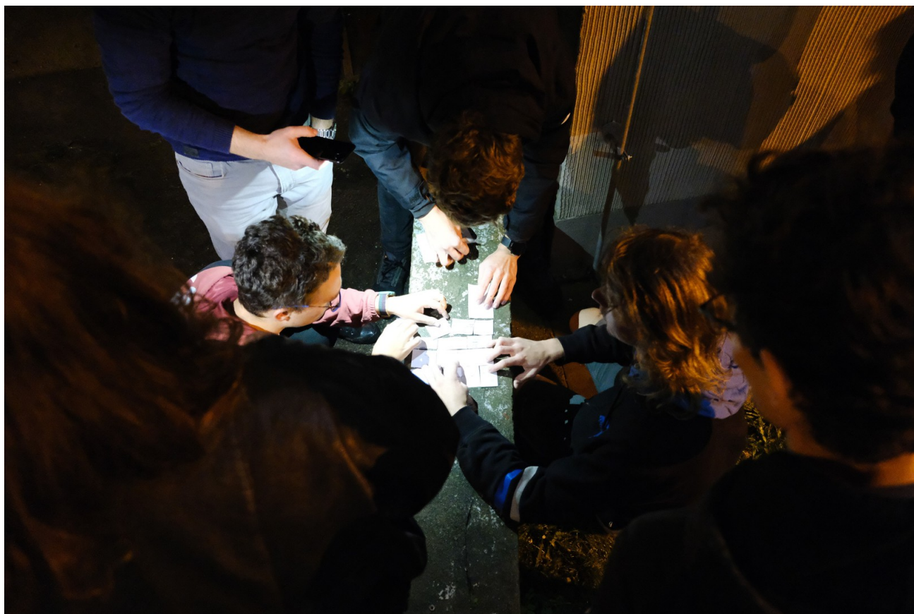
Obrázek 13: Závěrečné zimní Blokové hry