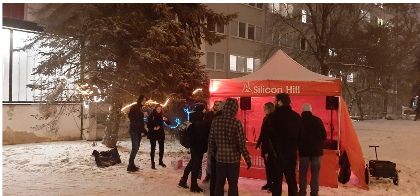
Obrázek 14: Rozsvícení SHtromečku

Poprvé od roku 2019 se mohli aktivní i neaktivní členové klubu setkat u rozsvícení vánočního SHtromečku u bloku 8. Akce bohužel mnoho členů nepřilákala, do dalších let by bylo vhodné zvýšit povědomí o této klubové tradici.