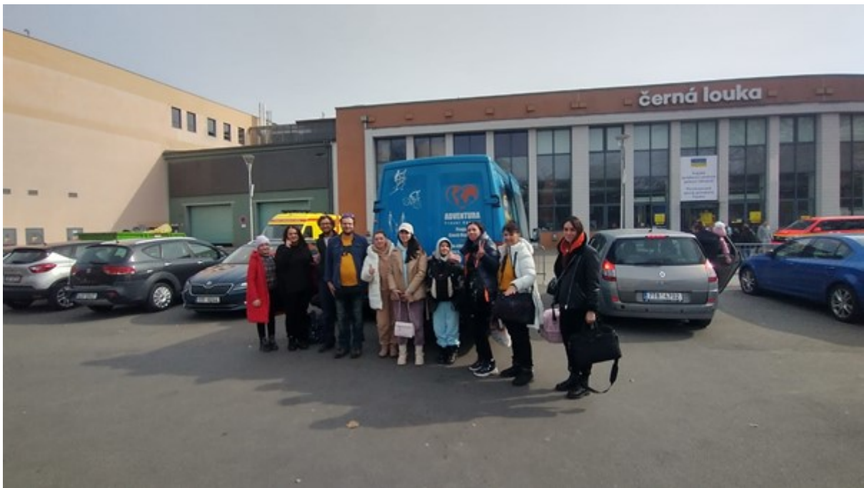
Obrázek 5: Pomoc Ukrajině