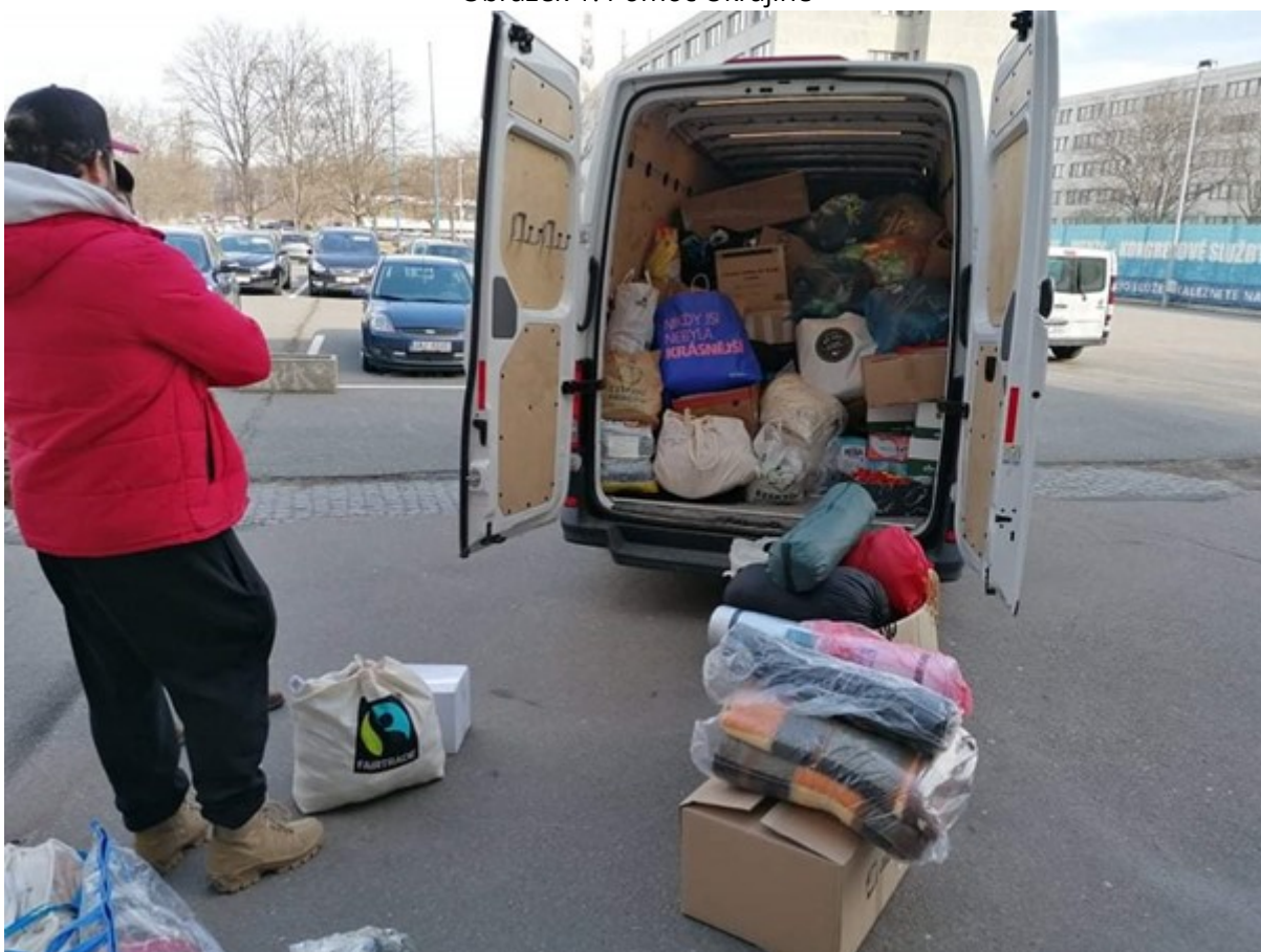
Obrázek 2: Pomoc Ukrajině