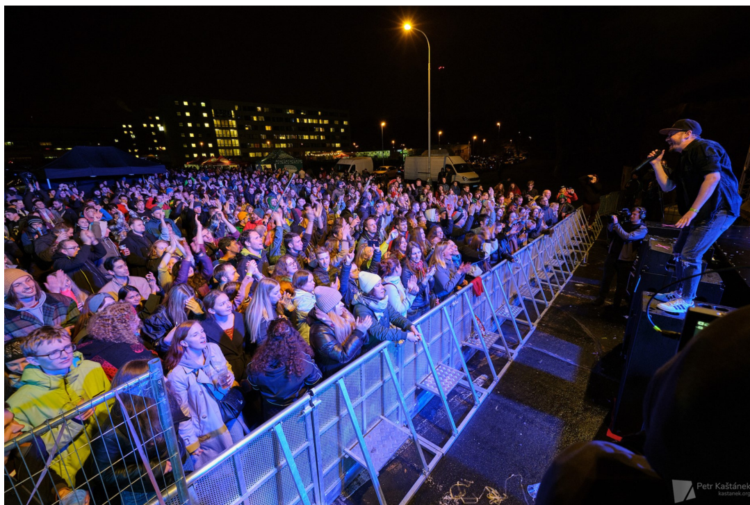
Obrázek 6: Velká stage SHOW

Festival nejen studentských kapel pro studenty. Mezi vystupujícími tento ročník byli například Špičková kultura, Jet Lag či Foggy Dude a headlinerem byla kapela UDG. Celá akce proběhla poprvé od ročníku 2019 v klasické „prezenční“ podobě s tradiční doprovodnou akcí Silicon Hill Strongest Man.