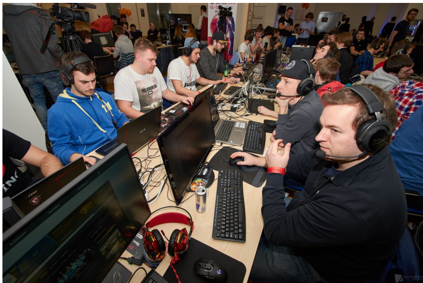
Obrázek 1: X LAN PARTY