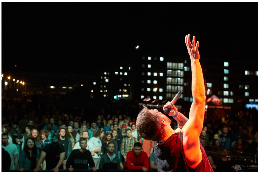
Obrázek 5: SHOW 2018