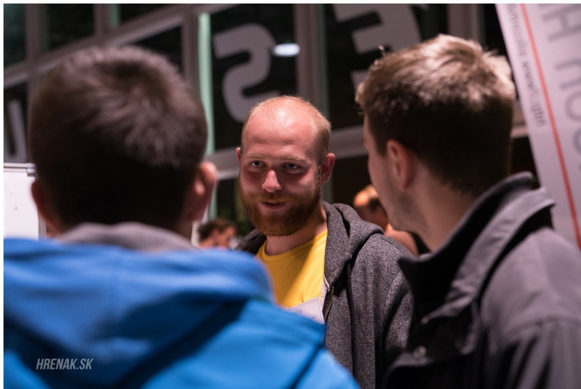
Obrázek 11: Akce prvák

Před začátkem zimního semestru padlo rozhodnutí konečně vyřešit problém se zatékáním do centrální serverovny na bloku 8, a to opravdu důkladně – došlo ke stěhování serverovny o pár místností vedle. Od SÚZ byly přebrány dvě místnosti pod vrátnicí, kde nejdříve došlo ke stavebním úpravám, následně členové z Admins a NetAdmins usilovně 14 dní pracovali na přestěhování celé infrastruktury (včetně UPS, klimatizací a navaření nové optiky) ze staré místnosti. Výsledkem je nová serverovna se zbrusu novými elektrickými, síťovými a klimatizačními rozvody a novými 4 racky s kvalitními PDU. Před samotnou serverovnou je navíc serverová laboratoř s oknem, které umožňuje pohled na racky se servery, a kde je možné v klidu pracovat na opravovaných serverech.