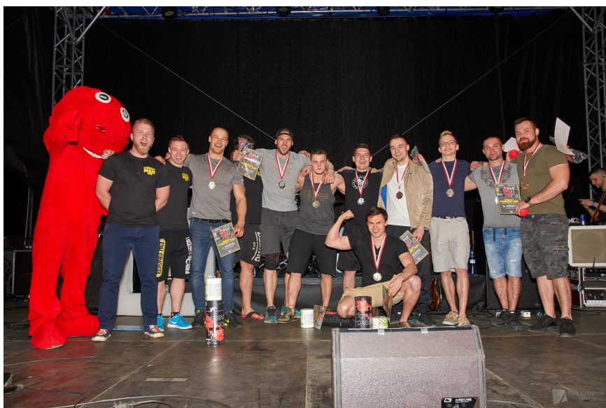
Obrázek 6: Silicon Hill Strongest Man 2018