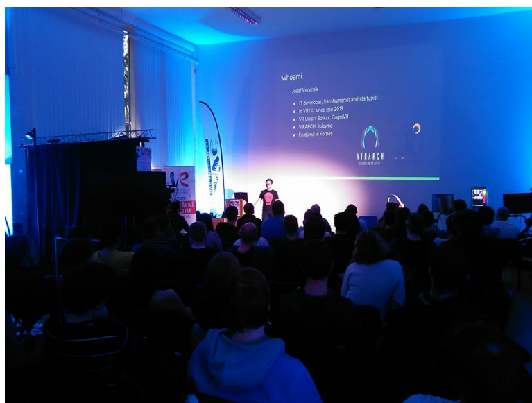
Obrázek 4: VR Fest 2018