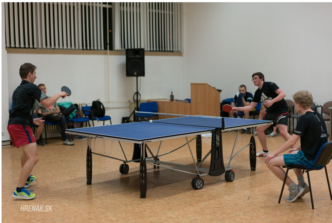
Obrázek 7: Finále ligy ve stolním tenise