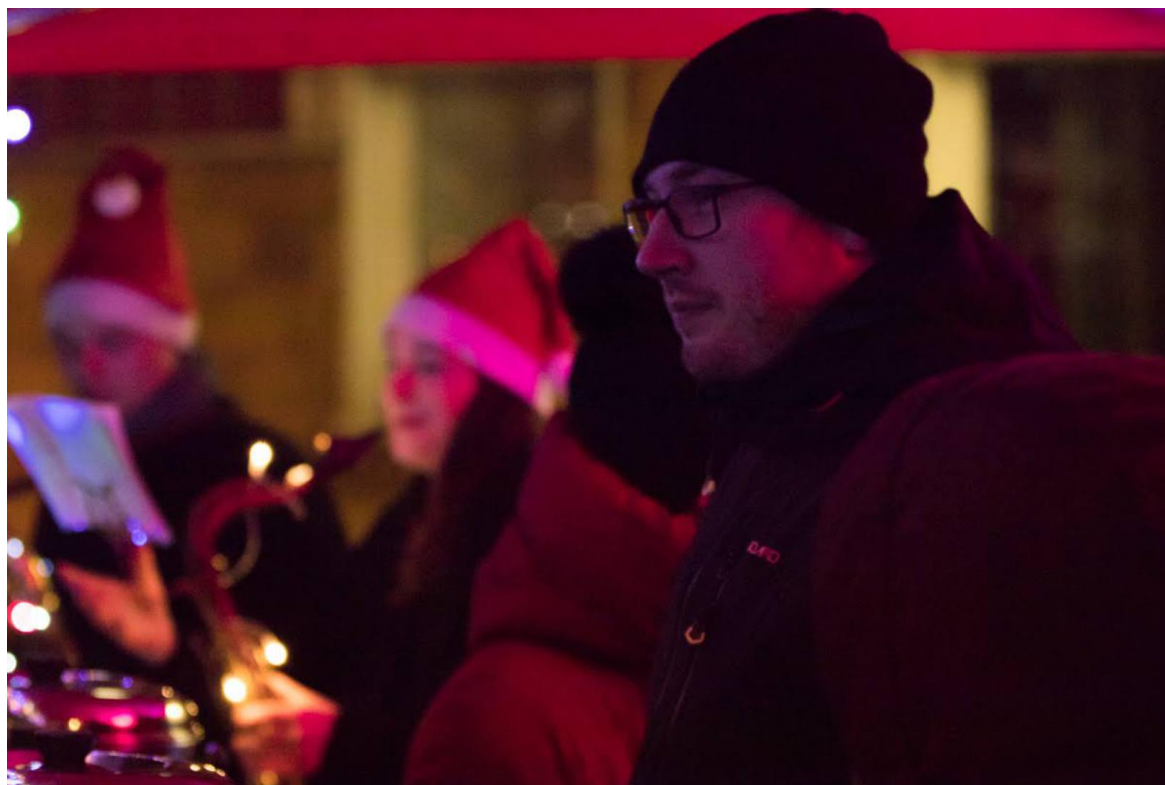
Obrázek 13: Rozsvícení vánočního SHtromku