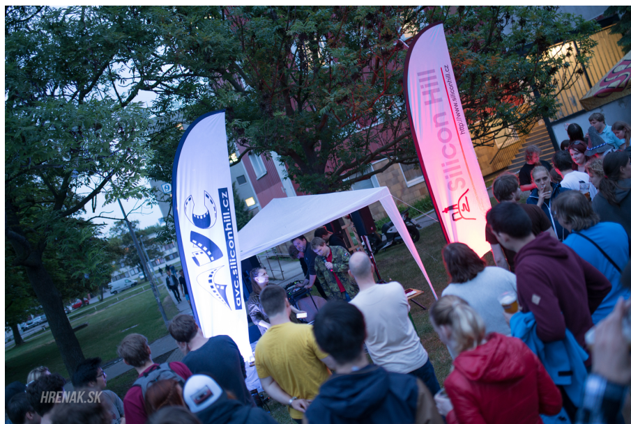
Obrázek 8: Oslava 20. narozenin SH