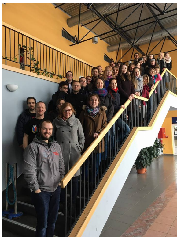
Obrázek 3: Překladatelský maraton