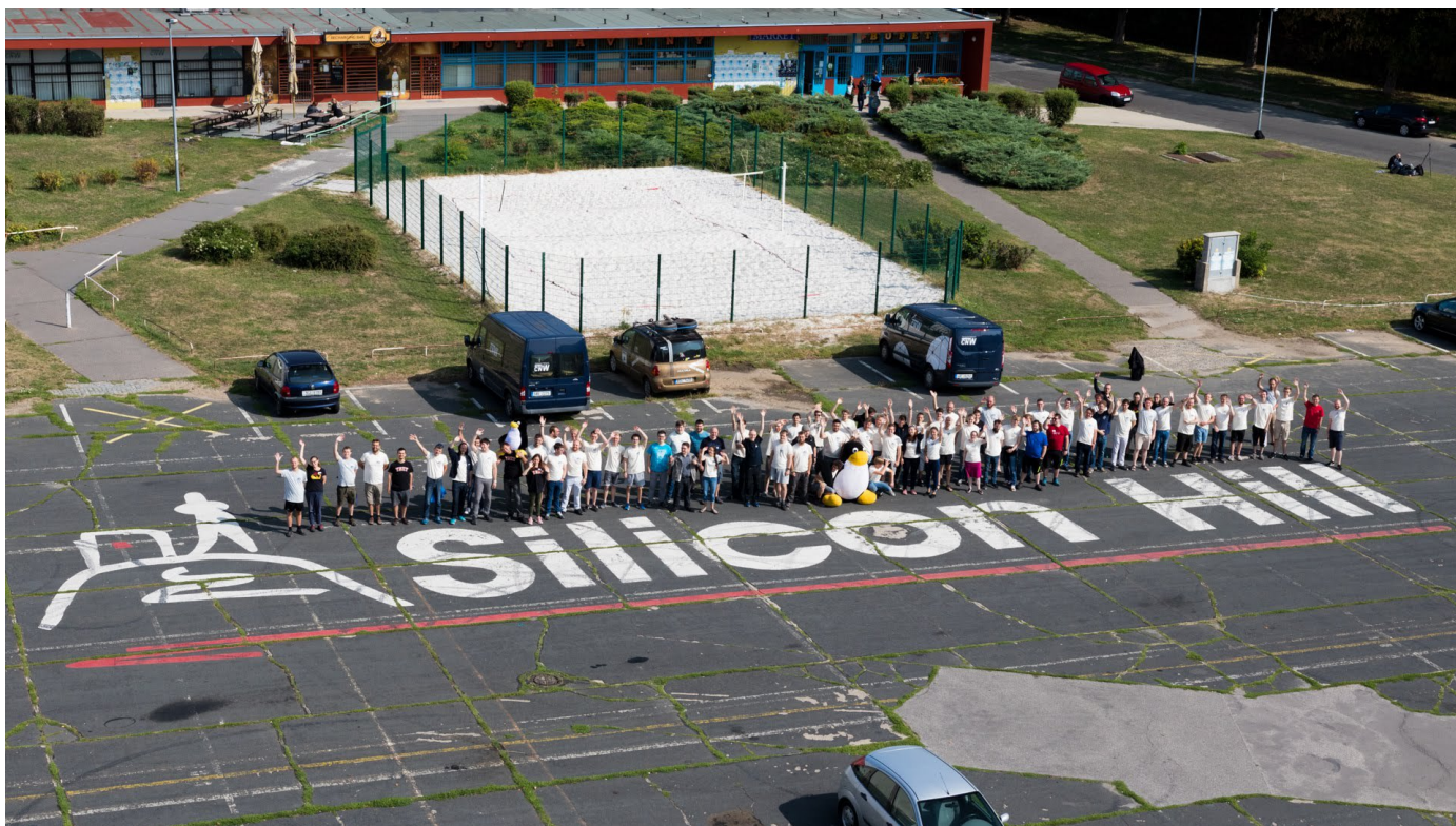
Obrázek 10: SNT 2018 in Prag