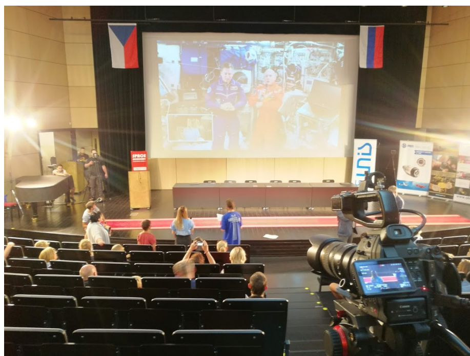
Obrázek 9: AVC.SH se spojuje s ISS