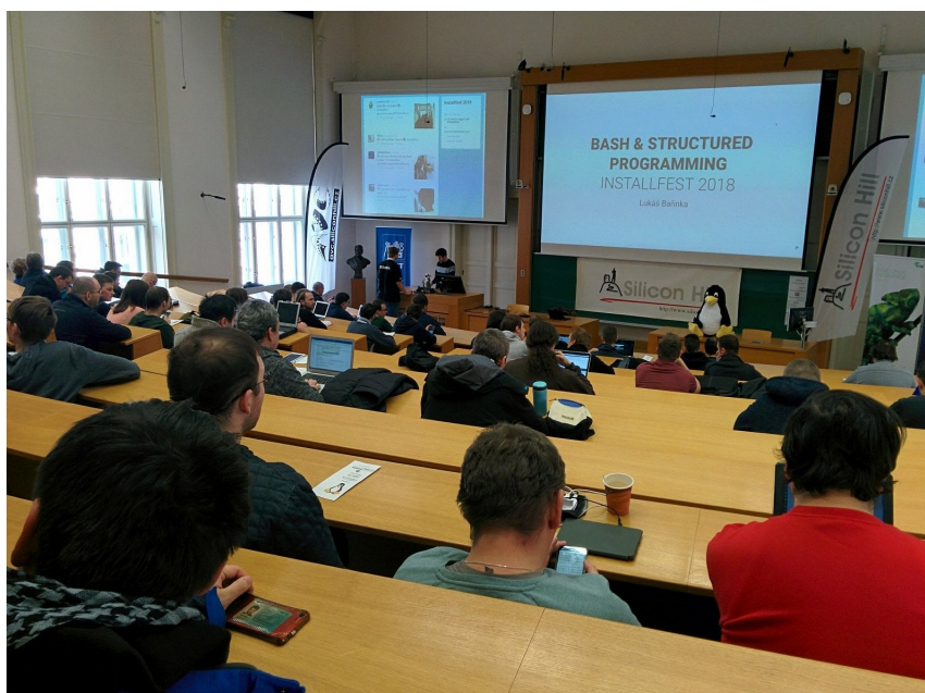
Obrázek 2: InstallFest